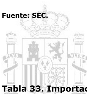
Tabla 33. Importaciones FOB europeas a Ecuador por país (miles €)